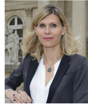
Virginie Duby-Muller, Députée de Haute-Savoie