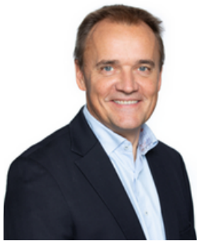
Anders Dorph, President of the Danish Gambling Authority

Le jeu en ligne illégal est en pleine expansion au point d'atteindre un seuil critique. Face à cette situation inédite et aux pratiques des sites illégaux : Quelles conséquences sur les pratiques addictives ? Quel modèle de régulation pertinent ? Quelles répercussions sur la protection des joueurs pour quel coût social pour la collectivité ? Les sites illégaux ont-ils définitivement gagné la partie ou est-il encore possible de reprendre la main ? Quelles actions pour lutter face à une cybercriminalité très organisée ?